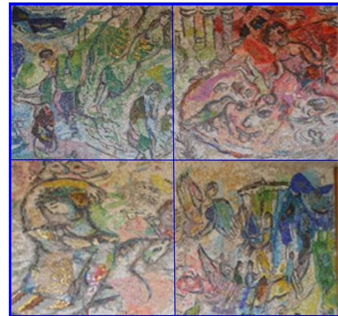
Fragment de la mosaïque de Chagall - Faculté de Droit et Science Politique de Nice